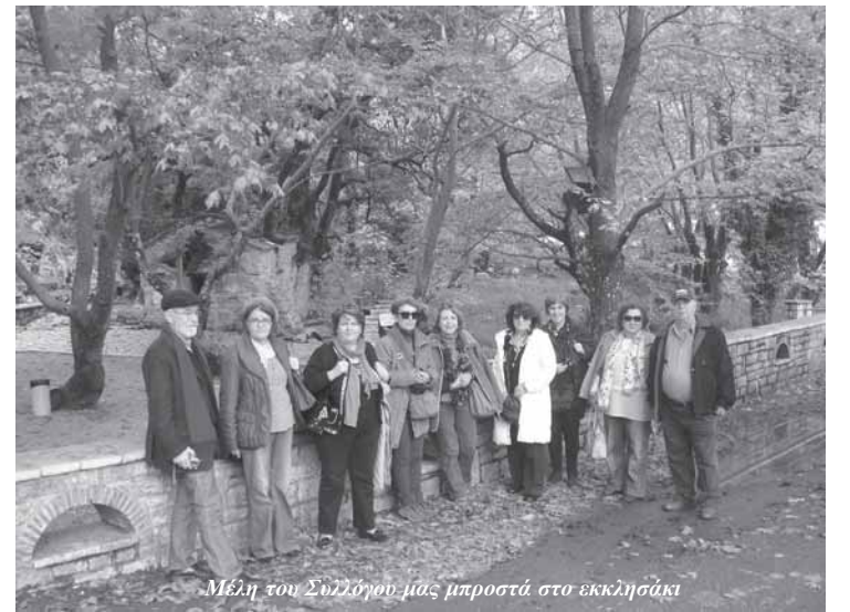
Μέλη του Συλλόγου μας μπροστά στο εκκλησάκι

Παρατηρώντας αυτούς τους χώρους αφουγκράζεσαι το παρελθόν, ακούς τους υπόκωφους ήχους, περιπλανιέσαι στην αιωνιότητα. Όμως, όπως πολλοί αρχαιολογικοί χώροι στην Ελλάδα, έτσι και της Μεγαλόπολης, είναι ξεχασμένοι στο βάθος των χρόνων και συνεπώς ανεκμετάλλευτοι και εκτός από το αρχαιολογικό χώρο ήταν κλειστός για το κοινό και τον