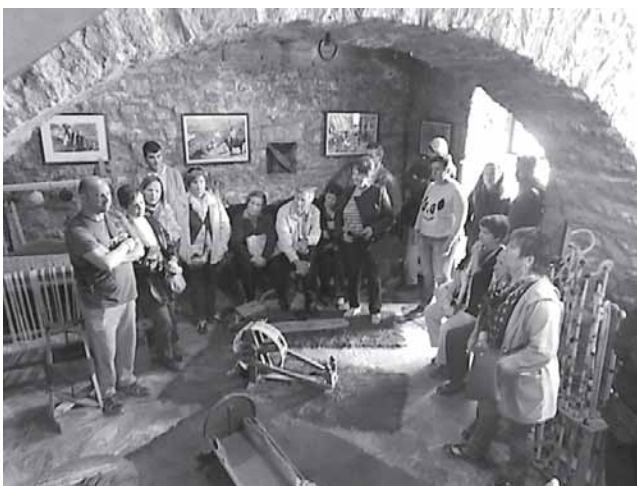
Στο σπίτι-Μουσείο του Κ. Κρυστάλλη στο Συρράκο.