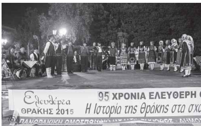
Η χορευτική ομάδα της Π.Α.Ο.Ν.Ε.