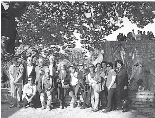
Στο γεφύρι της Άρτας.

Το τέλος της πρώτης μέρας μάς βρήκε να βολτάρουμε στο γεμάτο κόσμο κέντρο της Άρτας.