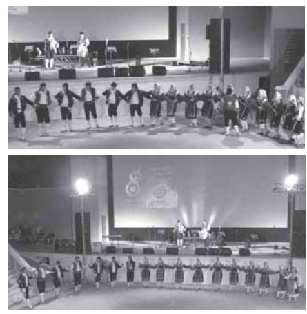
Από την εμφάνιση του χορευτικού στο 8ο Συνέδριο 2009.