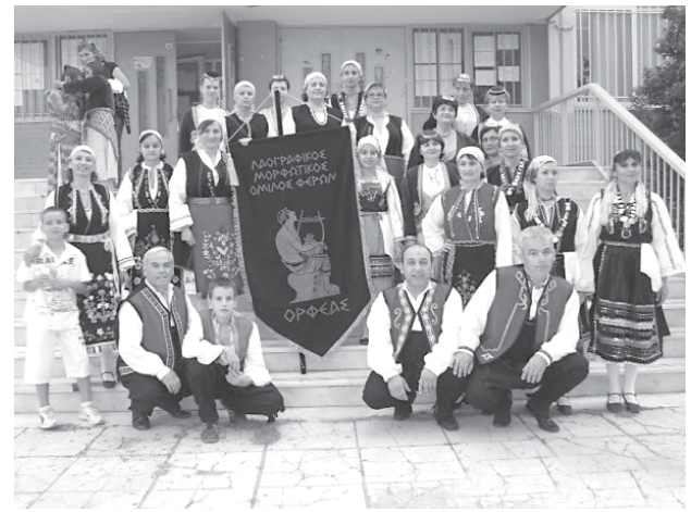
Στημιότυπα από εκδηλώσεις του Πολιτιστικού Ομίλου «Ορφέας» Φερών